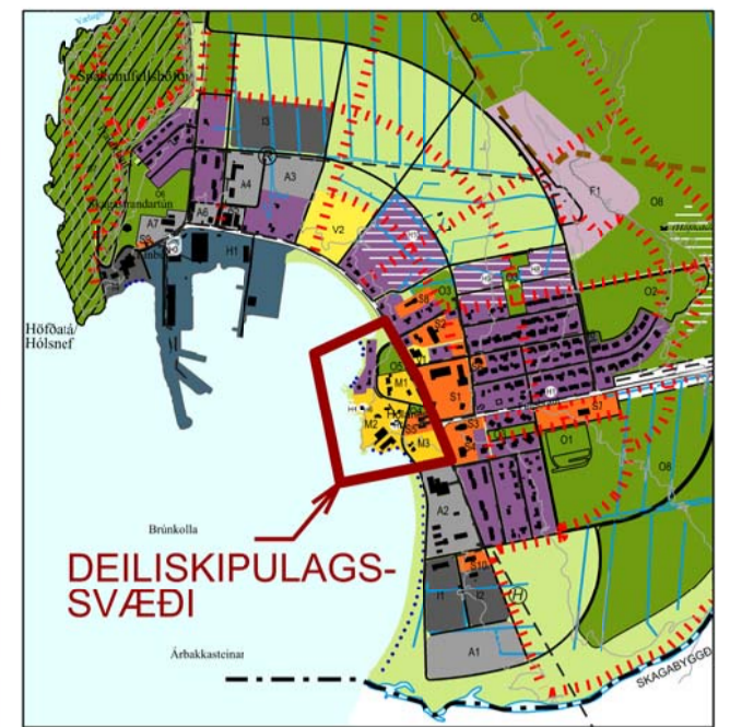
Staðfest Aðalskipulag Skagastrandar 2010-2022.