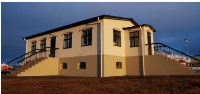
Bjarmanes eftir endurgerð

Bjarmanes var byggt 1912 af Verslunarfélagi Vindhælinga, upphaflega sem verslun og íbúð verslunarstjóra og gegndi því hlutverki í um 10 ár. Eftir það var það barnaskóli og samkomuhús til 1958. Húsið var gert upp og fært til upprunalegs horfs 2004.