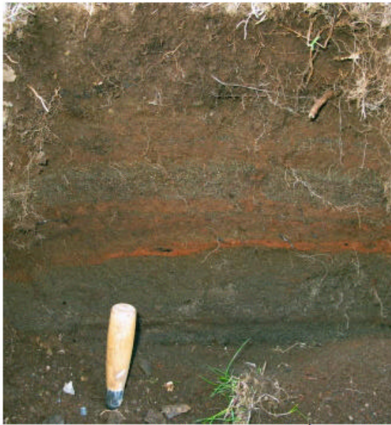
Mynd 19, austursnið skurðar bak við Árnes. Skaft mürskeidarinnar er 12sm langt.

Byggðasafn Skagafjarðar skoðaði jarðfundnar minjar í skurði sem hafði verið grafinn vegna lagfæringar á húsinu. Í skurðinum eru glögg merki um eldri mannvist, móska og kolaleifar. Engin gjóskulög fundust og því var ekki hægt að segja til um aldur mannvistarlaga.