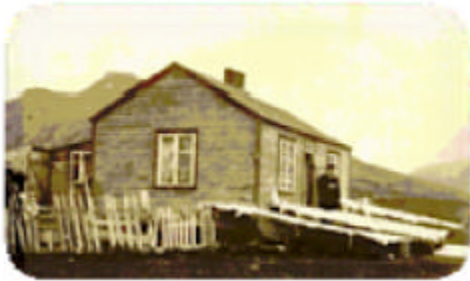
Árnes um aldamótin 1900, sem sýnir ágætlega hvernig húsið hefur verið í upphafi.